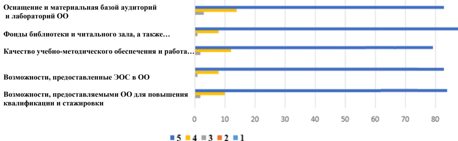
Удовлетворенность характеристиками рабочего места